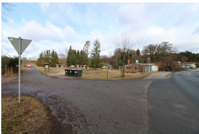
Blick von der Ravensbrücker Dorfstraße in Richtung Weidendamm